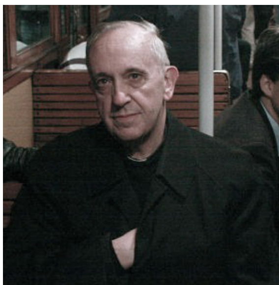
FIGURE 20.12 – François faisant un signe qui semble être le signe du Maître du second voile de la franc-maçonnerie

Récemment, les grands-maîtres des loges du Grand-Orient d'Italie et d'Argentine ont fait l'éloge de François [77] . Ceux-ci ont publiquement soutenu l'élection de François en tant que nouvel antipape.