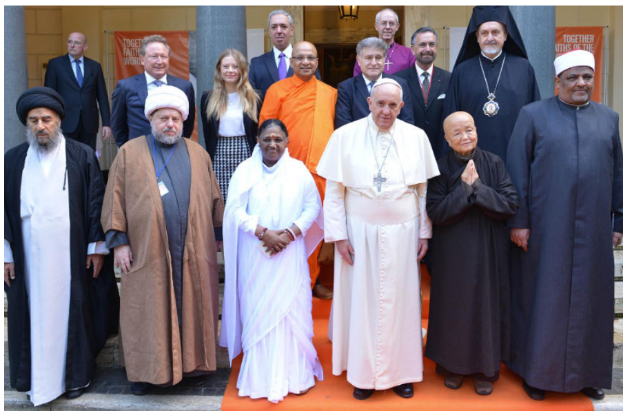
FIGURE 20.4 – L’antipape François en compagnie de représentants de diverses fausses religions