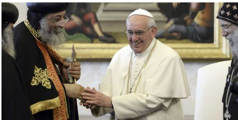
FIGURE 20.9 – L’antipape François au côté du schismatique Tawadros II

François, Discours , vœux au soi-disant pape orthodoxe schismatique d’Alexandrie, Égypte ; 10 mai 2013 : « Votre Sainteté, en vous assurant de mes prières afin que tout le troupeau confié à vos soins pastoraux soit toujours plus fidèle à l’appel du Seigneur, j’invoque la protection commune des saints Pierre Apôtre et Marc évangéliste... » [67]