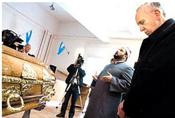
FIGURE 20.3 – François en prière devant le corps décédé du directeur musulman du Centre islamique, en Argentine

Le 2 août 2005, François pria devant le corps décédé du directeur musulman du Centre islamique, en Argentine. Le corps était orienté vers l'Est, face à la Mecque. Un imam islamique récitait des versets du Coran et demandait des bénédictions à Mahomet. Voilà ce que François déclara : « Par ma prière, je demande au Créateur, le Très Miséricordieux, de le récompenser pour tout le bien qu'il a fait. » [24]