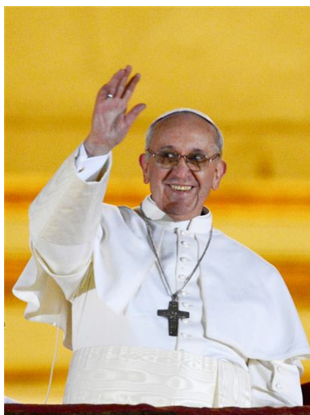
FIGURE 20.7 – L'antipape François saluant la foule tout juste après sa pseudo élection

En 2006, François s'agenouilla pour recevoir une bénédiction de la part de protestants lors d'une rencontre œcuménique [62]. François fit la même chose immédiatement après avoir été élu antipape le 13 mars 2013. Au lieu de bénir les gens, François demanda aux gens de le bénir, alors que la foule comprenait des membres de diverses religions non-catholiques. [63]