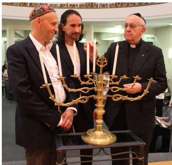
FIGURE 20.1 – François allumant une Menorah