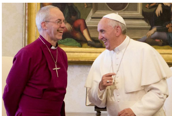
FIGURE 20.8 – L'antipape François en compagnie du chef schismatique de la secte anglicane, Justin Welby

Dans son discours du 14 juin 2013 au schismatique Welby, François disait l'accueillir « non comme des étrangers ni des hôtes ; vous êtes concitoyens des saints, vous êtes de la maison de Dieu. » [65]