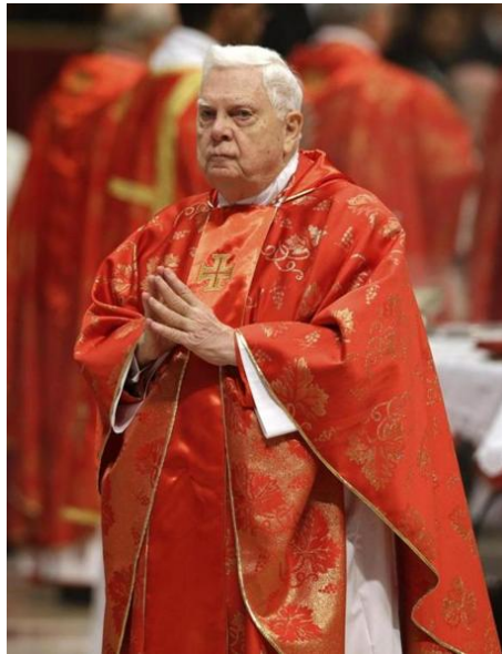
FIGURE 22.1 – L'ancien « Cardinal » de Boston, Bernard Law, présida à l'immense scandale sexuel de la secte Vatican II

CBS News — « Des membres du clergé, ainsi que d'autres individus de l'archidiocèse de Boston, auraient vraisemblablement abusé sexuellement de plus de mille personnes en soixante ans, déclara mercredi le procureur général du Massachusetts, parlant d'un scandale tellement énorme qu' " on se trouve à la limite de l'incroyable. " » [1]